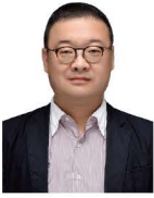
제4차 산업혁명 혁신선도대학 사업단 단장